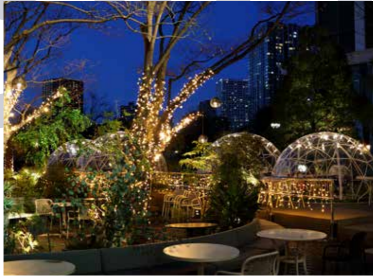
「RIDE」のテラス席では、真冬のアウトドアを楽しむ施策としてこたつ席やドーム型テントを導入した。