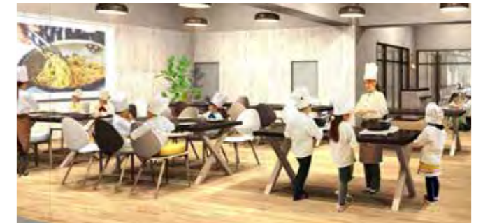
JR土浦駅に誕生する「STATION LOBBY」では子供料理教室の開催や学生向けのラウンジスペースの設置を行い、地域コミュニティの創出を図る。