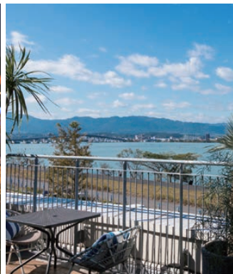
絶好のレイクビューを借景とした「オレンジバルコニー」

上半期としての新規出店は2店舗となりますが、1年2年と温めてきたプロジェクトのお披露目の準備をしっかりとる期間でもありました。共に働く新たな仲間を迎え入れることはもちろん、スタッフ自らが学び、習得した技術や知識を仲間に伝