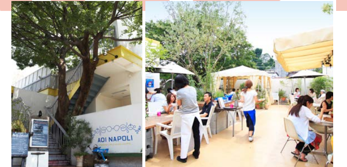
9周年を迎えた小石川の「青いナポリ」

さん)が我々の特質や、やりたいことをご理解いただいたの契約がほとんどで「しっかり長くやっていってください」とおっしゃっていただいています。不動産デベロッパー各社からも街づくりすら視野に入れた出店を要請される形になってきました。