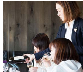
ソムリエが主催するワインセミナー

上半期としての新規出店は2店舗となりますが、1年2年と温めてきたプロジェクトのお披露目の準備をしっかりとる期間でもありました。共に働く新たな仲間を迎え入れることはもちろん、スタッフ自らが学び、習得した技術や知識を仲間に伝