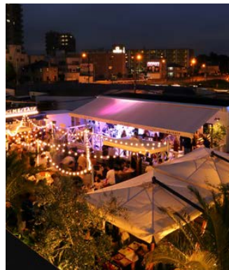
水戸市中心市街地に賑わいをもたらす「オープンテラス ミーイート」

昨年8月には茨城県水戸市中心市街地活性化に向けた新施設「まちなか・スポーツ・にぎわい広場」内において、周辺環境を活かしたオープンテラスカフェ「オープンテラス ミーイート」、11月には滋賀県守山市の「ピエリ守山」においてカフェ＆レストラン「オレンジバルコニー」をオープンいたしました。「オープンテラス ミーイート」はテラス席が大半を占めるので、冬季はこたつ席を設置し鍋を提供したり、店のど真ん中でキャンプファイヤーを行えるようにするなど様々な施策を導入しています。「オレンジバルコニー」は私たちにとって滋賀県で3店舗目となりますが、お陰様で多くの方に来ていただき、これからの京滋エリアの地域創生ネットワークの橋渡しを担う店舗になると思います。