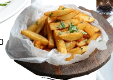
こだわりポテトフライ ¥580