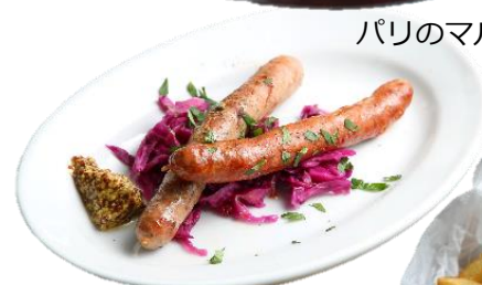
自家製ソーセージ ¥880