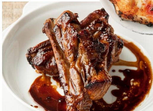
▲スペアリブのオープン焼き 550 (1本)

※メニュー名・価格は変更になる場合がございます ※ディナータイムの表示価格は税抜です