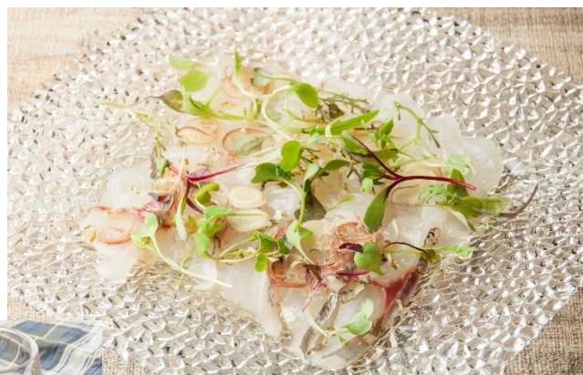
▲本日のカルパッチョ 1000